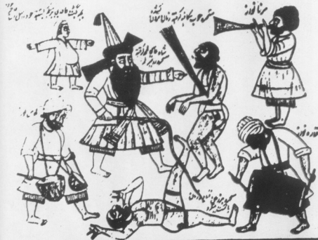
The early nineteenth century painting depicts the various humorous acts and musical instruments of Bhagats. See the master of the Bhagats bears the drum in central Asia.